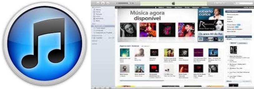
Resim 9 iTunes Store

“Apple ürünleriyle kusursuz şekilde çalışan bu program tüm Apple ürünlerini tercih eden kullanıcılar tarafından kullanılmaktadır. İlk olarak 2001 yılında ortaya çıkan bu ürünle müzik dinleyebilir, video yada film izlenebilir dahası apple ürünlerinize müzik, resim, video, e-book, uygulama ve oyun yükleyebilir, telefonunuzun ios yazılımını güncelleyebilirsiniz. Uygulamalar ücretli ya da ücretsiz olarak indirilmektedir. Kredi kartı seçenekleri ile alışveriş yapılabilirdiği gibi seçilmiş mağazalarda yer alan itunes hediye kartları ile de alışveriş yapılabilir. Ayrıca reklam amaçlı yada tamamen ücretsiz uygulamalar, oyunlar, kitaplar, tanıtım amaçlı müzikler vs de itunes store da yer almaktadır