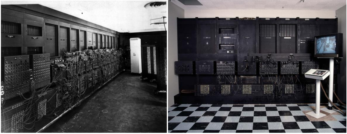
Resim 1-2. Eniac( Electronic Numerical Integrator And Computer )

Eniac'tan sonra “Ağustos 1982 yılında Commodore Business Machines tarafından piyasaya sürülen, Commodore 64 modeli tüm zamanların en çok satan ilk kişisel bilgisayar modellerinden bir tanesidir. Düşük ücreti ve gelişmiş donanımıyla kısa sürede birçok rakibini geride bıraktı.Commodore, C64'ün disket sürücünü üretmenin C64'ün kendisini üretmekten daha pahalıya neden olmasından dolayı Nisan 1994 yılında iflas etti”(İnternet kaynak no:4).