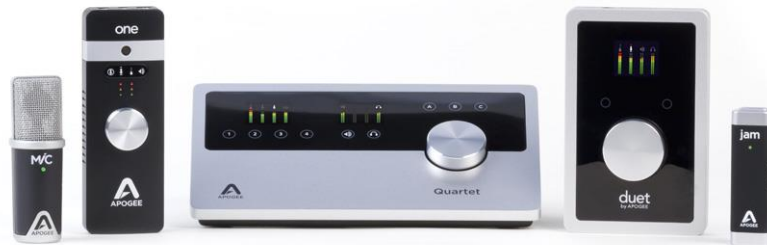
Resim 6 Kişisel Bilgisayarlarda ve Tablet Bilgisayarlarda Kullanılabilen Ses Kartı ve Mikrofon ve Mixer Örnekleri

Bilgisayar ortamında dijital seslerin işlendiği birimler vardır. Bunlardan en önemlisi ses kartlarıdır. “Ses kartı bilgisayardaki dijital ses verilerini analog ses sinyallerine, analog ses sinyallerini de bilgisayarda işlenebilecek dijital sinyallere dönüştürür.Ses kartları anakartın genişleme yuvasına takılır. Bilgisayarda ses kartı olmaması bilgisayarın çalışmasını engellemez. Sadece ses ile ilgili işlemler yapılmaz”(İnternet kaynak no:7). Ses kartları günümüzde harici olarak da kullanılabilir. Özellikle gelişen teknolojinin son ürünleri olan tablet bilgisayarlarda bile çalışan üzerlerinde dahili mikrofonda bulunan modellerde ses kartları da üretilmektedir.