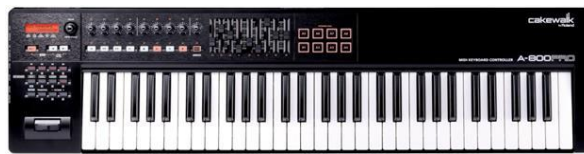
Resim 8 Midi Klavye

Dijital müzik çalışmalarında önemli yer tutan bir diğer araç da midi klavyelerdir. "Midi klavye, midi mesaj gönderme ve alabilme özelliği olan elektronik müzik enstrümanıdır. Genelde midi klavyeler ses bankası bulundurmazlar. Yani midi klavyeyi açıp, bir tuşuna bastığınızda ses çıkmaz. Sesi sağlayan donanım ayrıdır, genelde ses modülü olarak geçer"(İnternet kaynak no:9). Bilgisayar veya tabletlerde yer alan programlardaki ses kütüphanelerini kullanarak midi klavye aracılığıyla her enstrüman grubuna ait sesleri rahatlıkla kullanabiliriz.