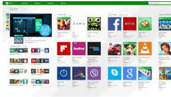
Resim 11Windows Store

Windows Store uygulamaları, Microsoft 'un yeni teknolojisi ile gelip, multi-platform uyumluluk özelliği vardır. Yani hem Windows8 PC ve Laptoplarda, hem microsoft'un yeni gözdesi olan Surface tabletler için ortak geliştirilen uygulama türüdür. Çıktığı andan itibaren bir çok uygulama geliştirilmiş olup, uygulama geliştirmek ve para kazanmak isteyen yazılımcılar sayesinde hızla büyümektedir.