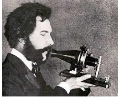
Resim 5 İlk Mikrofon

Bilgisayar ortamında dijital seslerin işlendiği birimler vardır. Bunlardan en önemlisi ses kartlarıdır. “Ses kartı bilgisayardaki dijital ses verilerini analog ses sinyallerine, analog ses sinyallerini de bilgisayarda işlenebilecek dijital sinyallere dönüştürür.Ses kartları anakartın genişleme yuvasına takılır. Bilgisayarda ses kartı olmaması bilgisayarın çalışmasını engellemez. Sadece ses ile ilgili işlemler yapılmaz”(İnternet kaynak no:7). Ses kartları günümüzde harici olarak da kullanılabilir. Özellikle gelişen teknolojinin son ürünleri olan tablet bilgisayarlarda bile çalışan üzerlerinde dahili mikrofonda bulunan modellerde ses kartları da üretilmektedir.