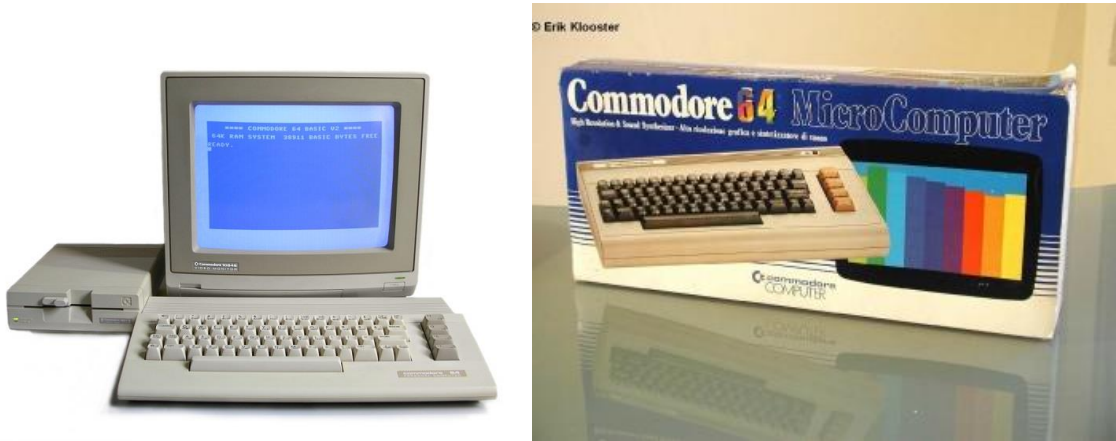
Resim 3 Commodore 64

Bilgisayarlar gelişirken eş zamanlı olarak müzik endüstrisinde de önemli gelişmeler ortaya çıkıyordu. Müzik alanında dijital müzik işlemlerinin en önemli parçalarından birisi de hoparlörlerdi. “Hoparlör, elektrik akımı değişimlerini ses titreşimlerine çeviren alettir.İlk hoparlör Rice ve Kellogg tarafından 1924-1925 yıllarında